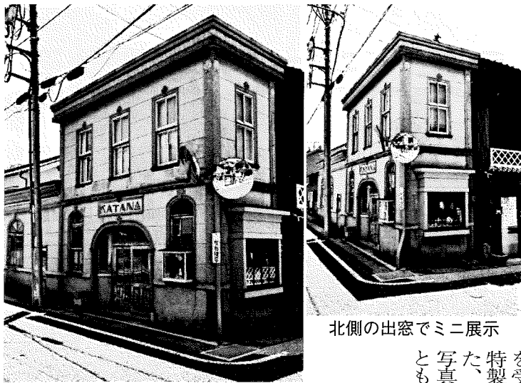
正面店舗看板もデザイン性が高い